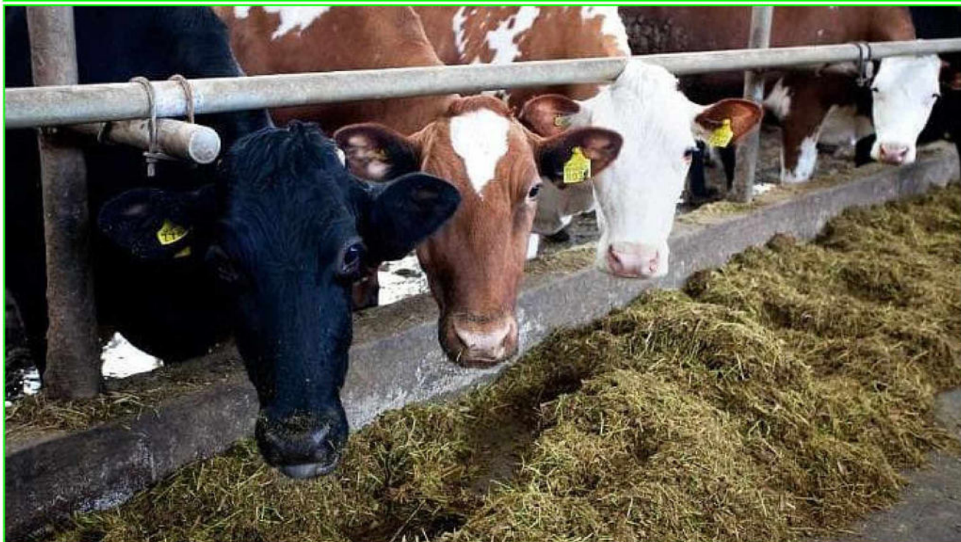
Оперативная сводка по животноводству 20.02.2021